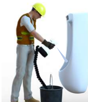
容器を問わずに水があればオゾン水を生成できます

★ YS500-ZWA は、世界最先端の高性能ダイヤモンド電解セル内蔵により、高濃度&大容量のオゾン水を生成&散布します。