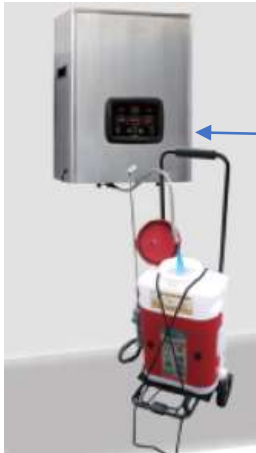
壁掛け式オゾン水製造装置 & オゾン水散布機