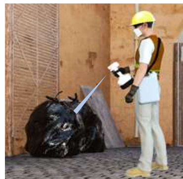
容器を体にかければどこでも除菌・脱臭できます