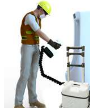
10L ボトル/カート使用