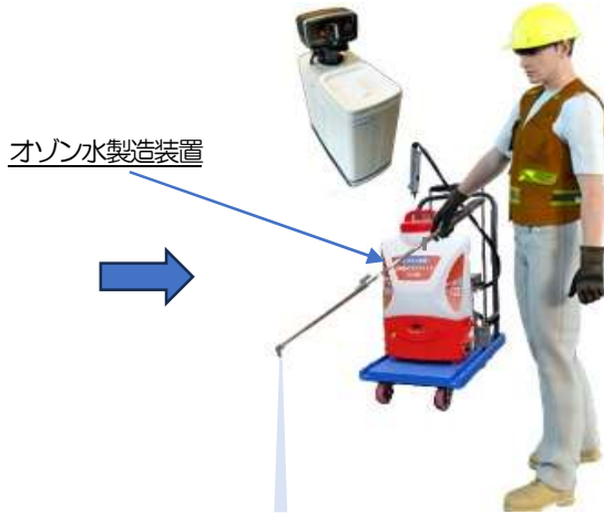
移動式オゾン水製造&散布機 ナノバブル超軟水生成器