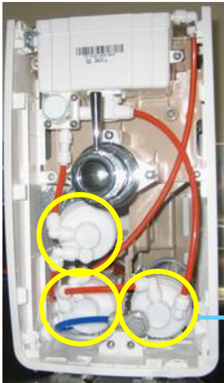
フロントカバーを外した前面内部