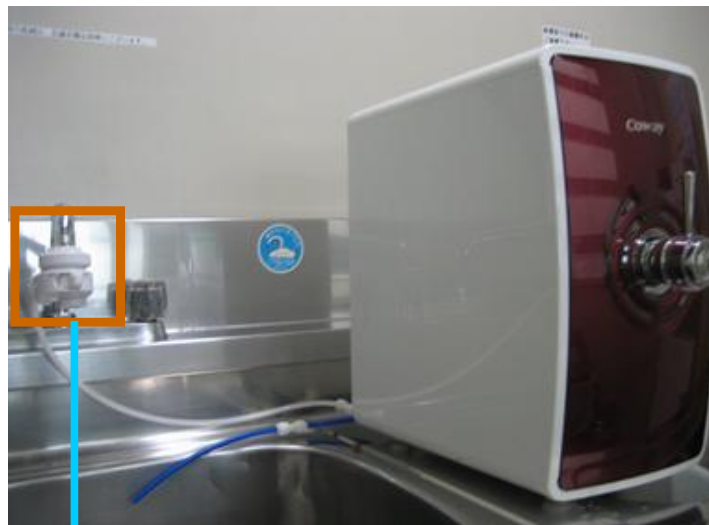
簡易分岐栓 (簡単に取付できます)