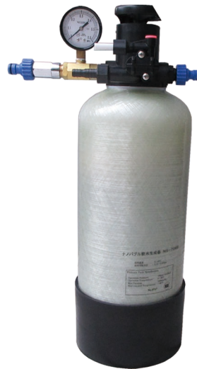
手動再生方式 ナノバブル超軟水生成器 NS-70MB