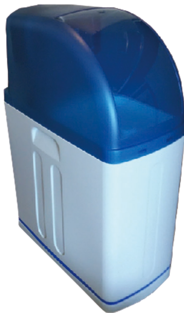
全自動再生方式 ナノバブル超軟水生成器