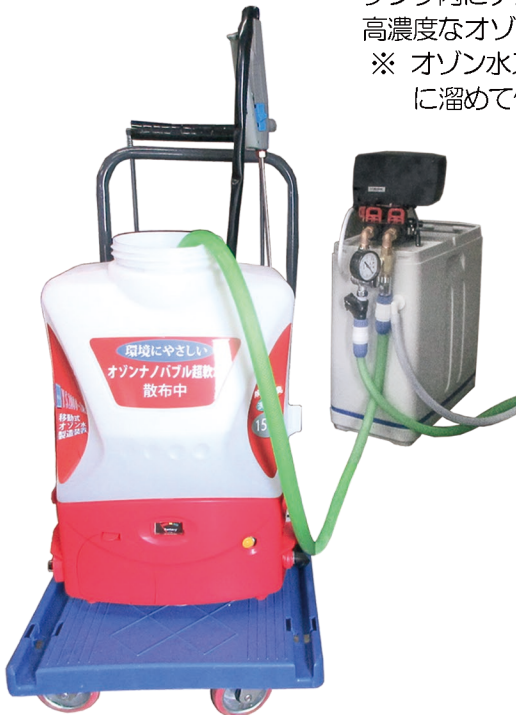
ナノバブル超軟水を付属タンクへ補充