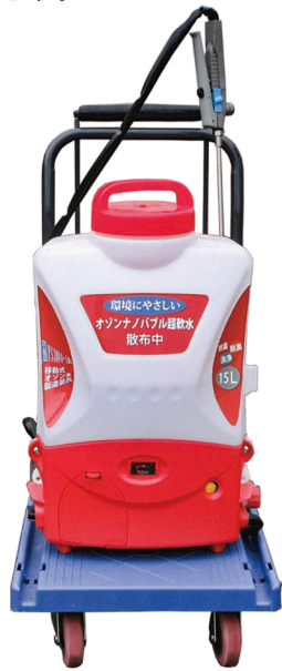
移動式オゾン水製造装置