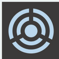
正面から見た受電極